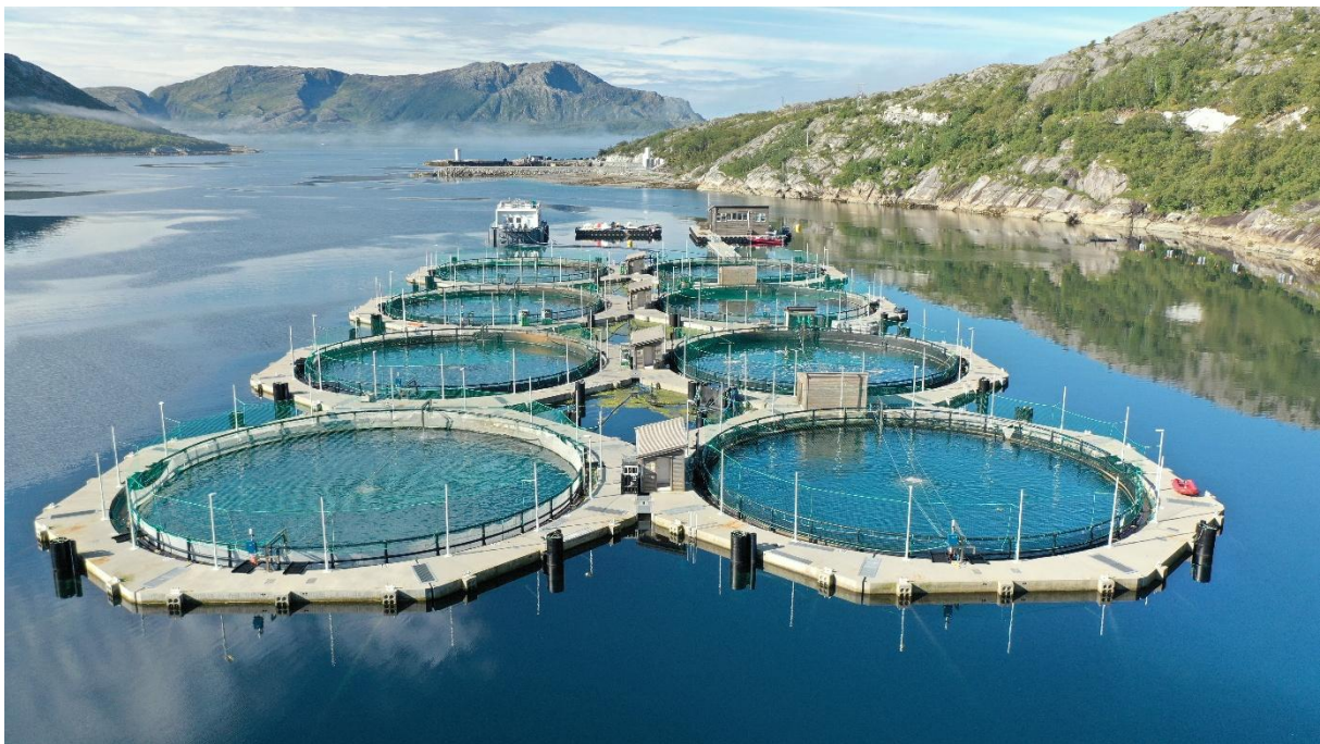
Figur 2: Lokalitet Andalsvågen, Brønnøy kommune.

Vannet i enheten strømmettes for å trimme fisken og gi god vannutskiftning. Vannparametere overvåkes kontinuerlig, og oksygenivå reguleres gjennom automatisk tilsetning for å sørge for stabile forhold.