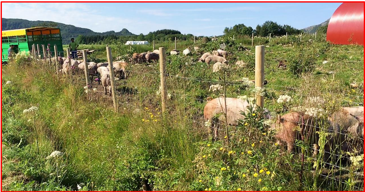
Mens grisfjøsset ble desinfisert og stod tomt var grisen på sommerferie. Utegangargris inntil Fylkesveien var en positiv opplevelse for mange sommeren 2018.

Også når det gjelder svineproduksjonen gjør de seg bemerket. De har i sommer lagt om til SPF-produksjon (Specific pathogen free). Dette er en felles satsing som en samlet svinenæring står bak og hvor målet er å utvikle ekstra friske griser. Dette innebærer blant annet strenge krav til helseovervåkning og dokumentasjon på at man har frisk gris før man får denne godkjenningen.