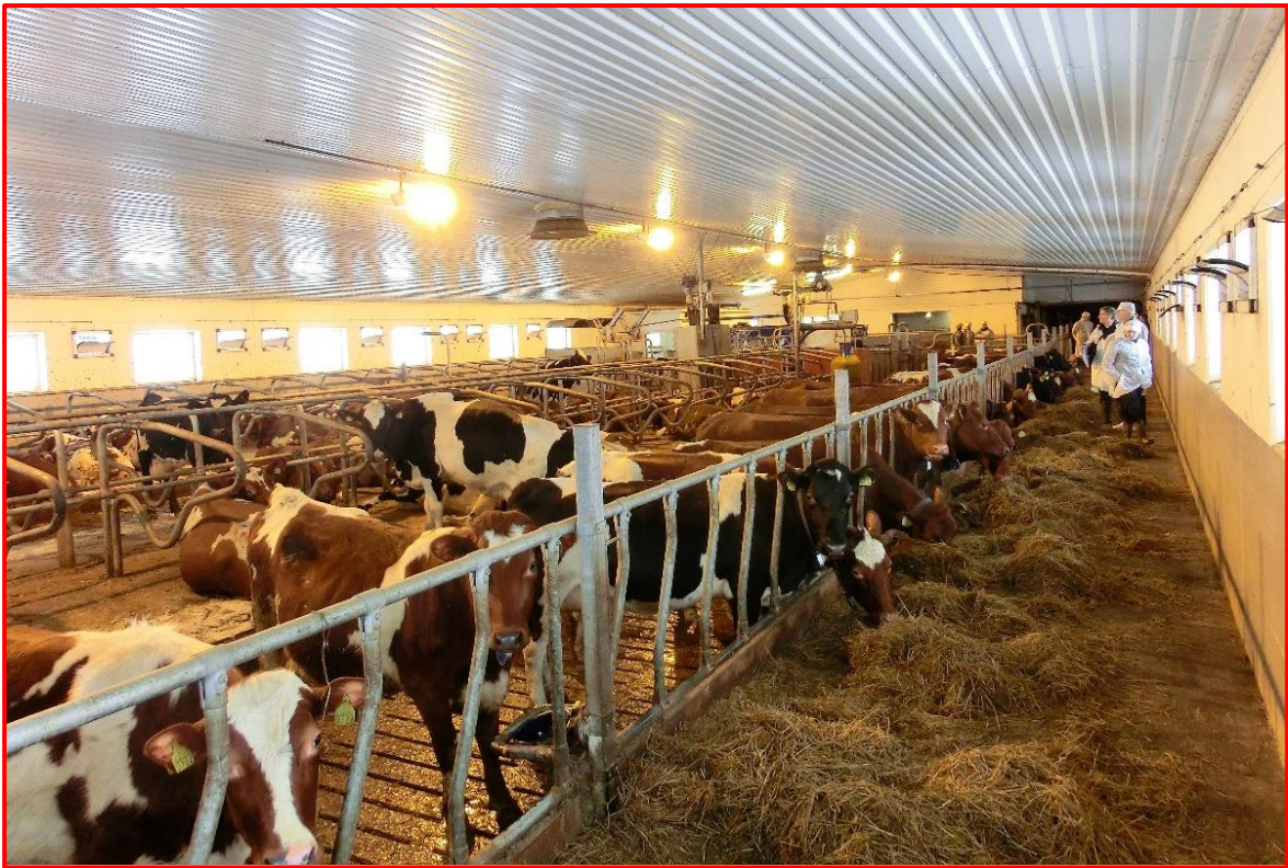
Løsdriftsavdeling med melkerobot.

Også når det gjelder svineproduksjonen gjør de seg bemerket. De har i sommer lagt om til SPF-produksjon (Specific pathogen free). Dette er en felles satsing som en samlet svinenæring står bak og hvor målet er å utvikle ekstra friske griser. Dette innebærer blant annet strenge krav til helseovervåkning og dokumentasjon på at man har frisk gris før man får denne godkjenningen.