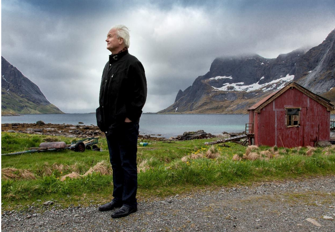
Lofoten Internasjonale Litteraturfestival «Reine Ord - et hav av bøker» er en av litteraturfestivalene i Nord-Norge. Ketil Bjørnstad har deltatt.

Litteraturfestivalene er arenaer for samarbeid mellom de ulike aktørene i litteraturfeltet og er naturlige møtesteder for dem som arbeider og er interessert i litteratur. Festivalene bør styrkes gjennom samarbeid og utvikling, slik at de er relevante for både publikum og litteraturmiljøet. Bibliotekene er naturlige samarbeidspartnere både på lokalt og regionalt nivå.