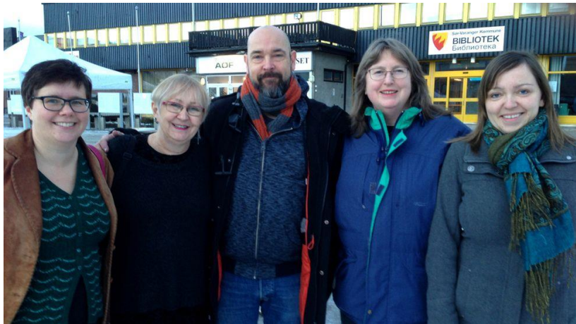
Styret i Nordnorsk forfatterlag 2017.

Nordnorsk forfatterlag ønsker at det opprettes ett årlig stipend pr. fylke på kr 100 000. Kriteriene og forvaltningen av et slikt stipend må legges til fylkeskommunene. Stipendmottakeren vil i tillegg til arbeidstid kunne få positiv oppmerksomhet, noe som vil fremme forfatteren og litteraturen