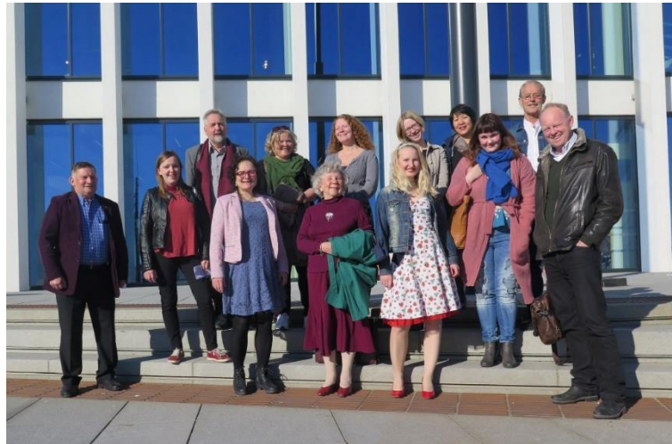
Nordnorsk bokdag ble i 2017 arrangert i Bodø.

For å styrke forfattermiljøet i landsdelen er det viktig med møteplasser og nettverksbygging, både lokalt, regionalt, nasjonalt og internasjonalt. Forarbeidet til strategien viser at informasjon og kommunikasjon innafør feltet er ei utfordring, og det er derfor ønskelig å etablere møteplasser for hele det litterære kretsløpet. Deltakelse på festivaler og konferanser er derfor viktig for å kunne møte andre i