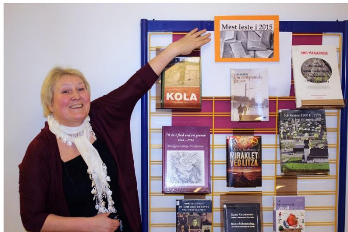
Lokale forfattere mest utlånt på Sør-Varanger bibliotek i 2015.

Per i dag er det lite litteraturkritikk i region- og lokalaviser. Dette gjør at litteraturen som blir gitt ut i landsdelen ikke får den oppmerksomheten den trenger for å nå ut til et større marked. Små forlag har ikke ressurser til markedsføring i samme grad som store forlag. Bibliotek og litteraturfestivaler er viktig for å gjøre den nordnorske litteraturen kjent. Bibliotekene er sentrale arenaer for litteraturformidling i regionen. Bokhandlere i landsdelen er også naturlige formidlingsarenaer.